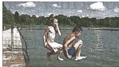
Furesøen har tidligere fået kunstigt åndedræt.