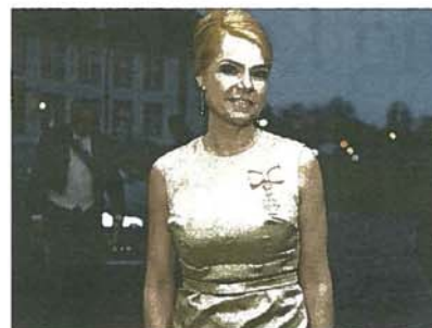
Inger Støjberg - her på vej til fest på Fredensborg Slot - har en kedelig rekord.